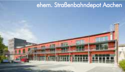
ehem. Straßenbahndepot Aachen