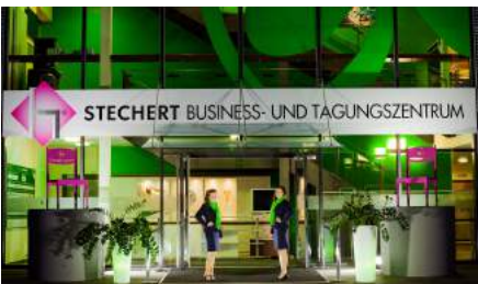
STECHERT BUSINESS- UND TAGUNGSZENTRUM

eine Fortbildungsveranstaltung der AFW · Akademie für Fort- und Weiterbildung Fliederstraße 24 · D-51643 Gummersbach Tel: +49 (0)2261-24482 · Fax: +49 (0)2261-9130141 E-mail: afw@lcs-afw.de