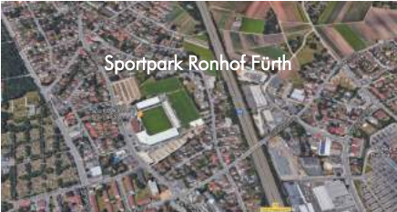
Sportpark Ronhof Fürth